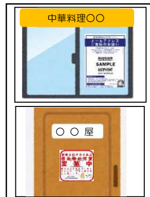
⑦⑧の提出例（貼付用フォーマットあり）

※ステッカー・ポスターと店舗名のわかる看板等と一緒に写真撮影してください。（看板等が映っていない場合、ポスターに記載の店舗名がわかる写真も可）