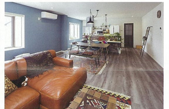
壁面やカウンターに貼ったプリストル・ブリックタイルや、統一されたブルーのクロスがアクセントになり個性的な雰囲気を作り上げます。