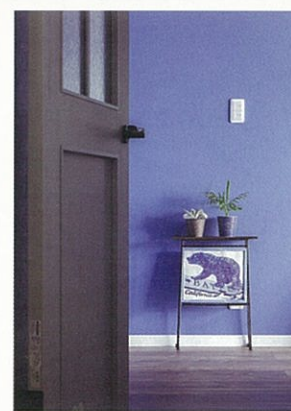
玄関収納やリビングの扉はLDKと同シリーズの素材を採用し、LDKとのつながりも感じさせます。