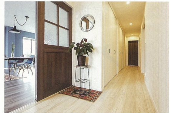
暗がりちな玄関ホールの床は明るい白木目のチェストナット柄、廊下収納の扉もホワイトで圧迫感なく開放的に感じる空間に仕上げました。